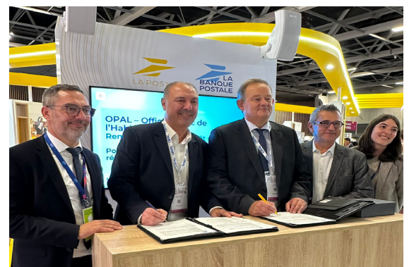
Sezaam, la Banque Postale, des partenariats importants pour notre Office et pour faire avancer notre territoire