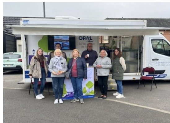
Moment convivial entre les locataires et les collaborateurs de l'Office

Le succès de cette édition confirme l'importance de poursuivre cette dynamique et réaffirme la volonté de l'OPAL de construire un territoire où il fait bon vieillir ensemble.