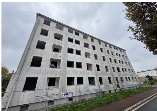
Les immeubles vétustes laisseront bientôt place à des maisons individuelles

Avec cette opération ambitieuse, l'OPAL continue d'agir pour un territoire plus durable, inclusif et tourné vers l'avenir, en proposant des logements de qualité au cœur de la ville de Tergnier.