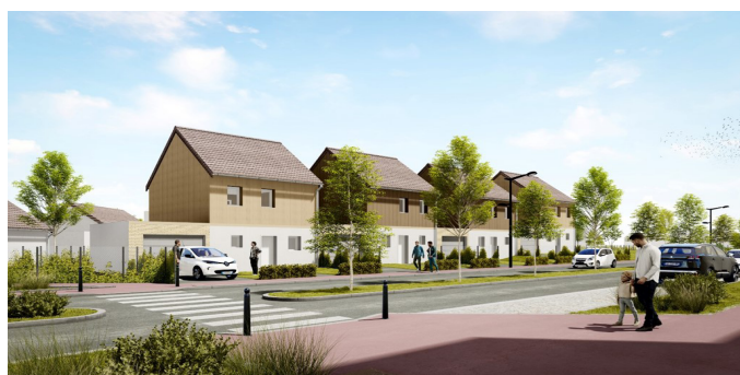
Perspective du projet