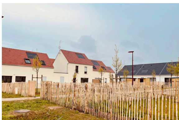
L'OPAL innove en construisant des logements à partir de matériaux biosourcés

Ce programme favorise également la mixité sociale et répond à des défis environnementaux, sociétaux et économiques.