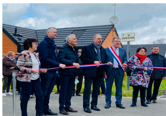
Différents élus du territoire ont coupé un ruban pour inaugurer le lotissement