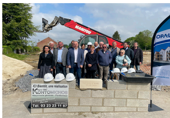
Un moment de convivialité entre élus, partenaires et collaborateurs de l'Office