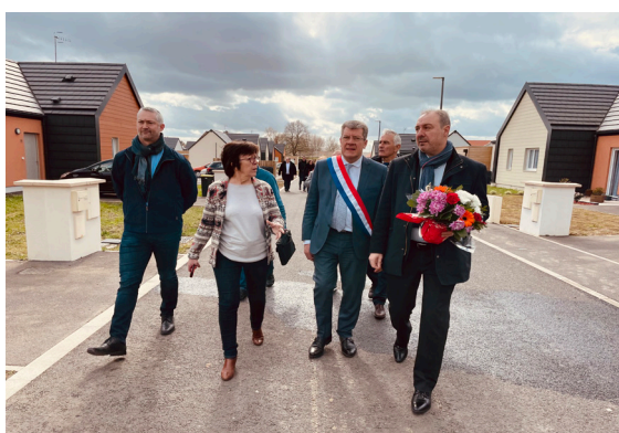
Visite du bégainage entre acteurs du territoire

L'Office, main dans la main avec les élus, travaille quotidiennement et sans relâche pour apporter des solutions d'Habitat adapté et durable.