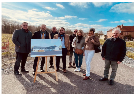
Élus et acteurs du territoire se sont réunis pour répondre à la presse

Le terrain se situe à proximité immédiate des commerces, des écoles et de la mairie avec un cadre de vie agréable entre la rue du Nouvion, qui traverse le bourg de part en part, et la rivière de l'Ancienne Sambre de Boué.