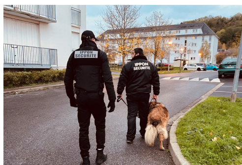
Les agents de sécurité patrouillent sur le quartier Montreuil à Laon

De 1 à 2 expulsions par an pour troubles, l'OPAL est passé à 9 en 2022. Les logements récupérés suite à une procédure d'expulsion pour troubles ont donc été multipliés par 5 entre 2021 et 2022.