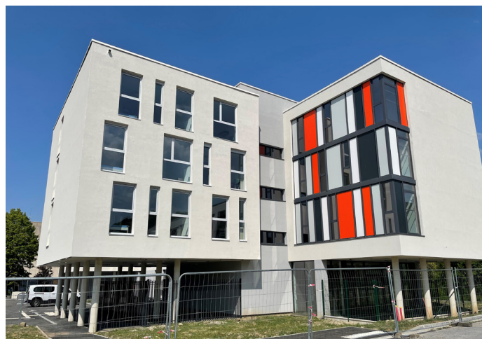
L'immeuble coloré est prêt à accueillir ses nouveaux résidents

25 logements destinés à des personnes adultes socialement fragiles, nécessitant un accompagnement sur le long terme, vont être construits.