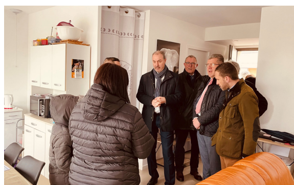
Des locataires du lotissement nous ont ouvert leur porte