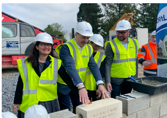
Lancement officiel de notre projet de construction de 19 logements

Nous veillons également à ce que les performances énergétiques de ces logements soient optimales, à la fois pour lutter contre la précarité énergétique mais aussi pour garantir la qualité de vie de nos locataires.