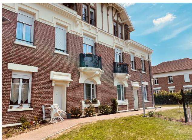
6 locataires de l'OPAL ont vu leur extérieur se transformer

Le 7 juin dernier à Gauchy, rue Claude Mairesse, arbres fruitiers et massifs floraux ont pris vie autour de l'une de nos résidences.