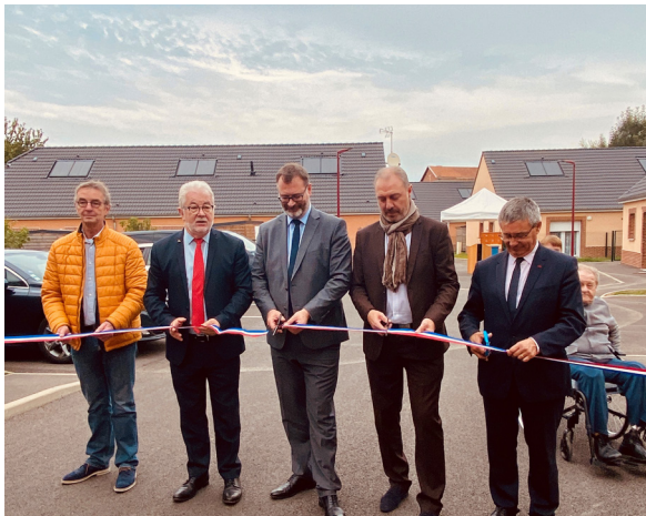
Durant cette journée, une inauguration a eu lieu à Hirson, rue de la Haie.