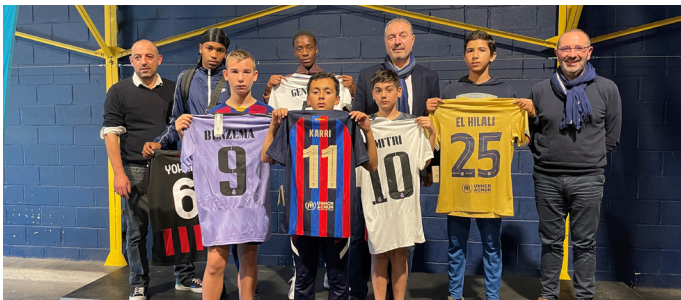
Quelques mois d'attentes et les voici en possession du maillot officiel de leur équipe favorite.