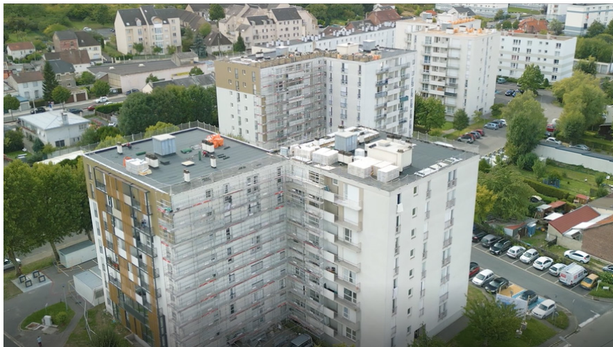
Sous nos yeux, la Résidence Jamin se transforme et se pare d'un manteau thermique.

À Laon, la Résidence Jamin se transforme. À l'image de la transformation de Chevreux à Soissons, cette résidence de 208 logements s'offre une nouvelle identité grâce à l'ITE, Isolation Thermique par l'Extérieur qui en plus de permettre plus de confort thermique et des économies d'énergie, apporte une nouvelle