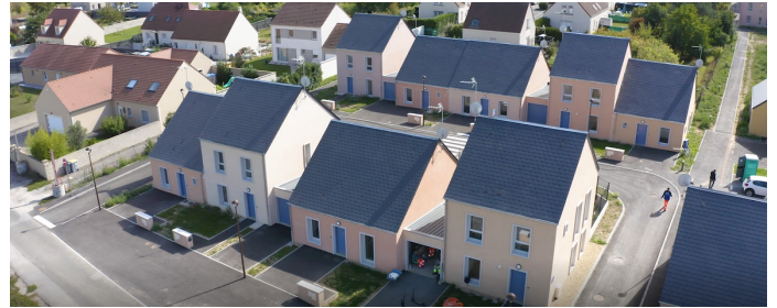
À Chierry, cette opération permet de répondre à la demande de la commune et de ses habitants.

Sur Chierry, une partie de la population est vieillissante et les logements ne sont pas toujours adaptés. Un programme comme celui-ci est une belle illustration de la réponse que peut apporter l'OPAL aux besoins d'une commune. L'autre volonté ? Plus de mixité sociale !