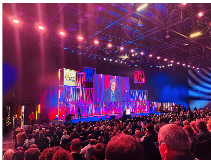
Cérémonie d'ouverture du 82 ème Congrès HLM

Véritable événement pour les acteurs du logement social, cette rencontre annuelle où plus de 16.000 personnes participent, a permis d'échanger autour de sujets d'actualité importants, tels que la crise énergétique et la valorisation des énergies mais également d'évoquer les grands enjeux des bailleurs sociaux comme les conséquences de l'inflation, la lutte contre le mal-logement et la transformation de nos territoires.