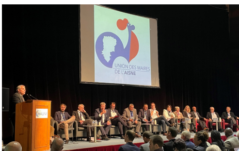
Toute la matinée, les élus du territoire ont pris la parole pour parler des grands enjeux de notre territoire.

Le but de cette journée : permettre à l'office de mettre en avant ses services auprès des acteurs du territoire. Habitat classique, spécifique, accession à la propriété, réhabilitation, innovation, modes d'intervention, l'OPAL a pu mettre en avant son savoir-faire et ses connaissances en matière d'Habitat.