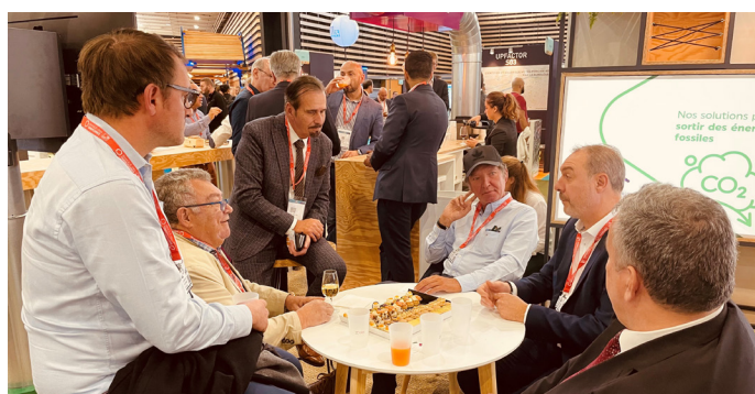
Moment de convivialité entre acteurs du territoire

Le maître-mot de ce congrès : Réussir ! Mais réussir ensemble !