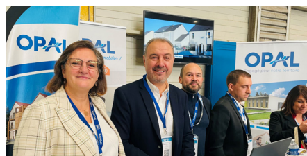
Le Président et les collaborateurs de l'OPAL sont allés à la rencontre des entreprises et des élus du département.

Enfin, nous avons mis en place la FIT pour Formation Intégrée au Travail. La FIT permet de former, sur site, les salariés des entreprises. Cela leur permet aussi de monter en compétence et d'acquérir une expérience de terrain pratique et qualifiante.