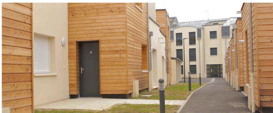
Ces logements neufs sont prêts à accueillir de nouveaux résidents.