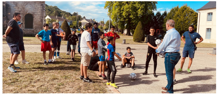
Cet été, les jeunes locataires de l'office ont tout donné pour remporter notre coupe du monde !

Plusieurs jeunes des quartiers de Montreuil et Champagne-Moulin-Roux et résidents dans des logements OPAL, s'étaient rendus devant le siège de notre office pour participer à cette compétition.