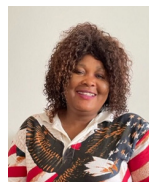
Bijou Odiwa Di Pungy Nimy Laon

À notre arrivée dans le quartier, il y a 2 ans, il n'y avait aucun souci. On pouvait entendre une mouche voler. Aujourd'hui, tout s'est dégradé. Il y a beaucoup de bruit, y compris la nuit. Certains jettent leur mégot n'importe où, parlent fort. On a l'avantage d'avoir un bailleur qui fait tout pour ses locataires (Isolation extérieure, espaces verts...) et les gens ne respectent rien. Ce n'est pas normal. J'espère que tout ce que l'OPAL va mettre en place changera cela.