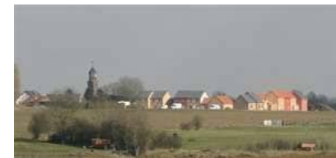
Arrêté d'autorisation N° LT0256907 B0001 délivré le 17 juillet 2007 - déposé en mairie