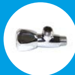
Robinetts d'arrivée d'eau